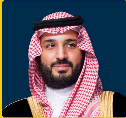
صاحب السمو الملكي الأمير محمد بن سلمان بن عبد العزيز آل سعود ولي العهد رئيس مجلس الوزراء