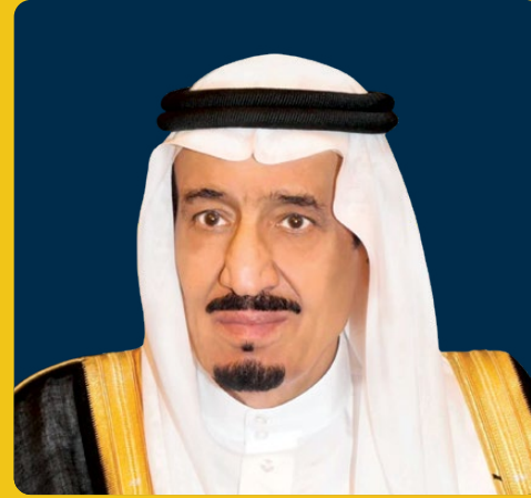
خادم الحرمين الشريفين الملك سلمان بن عبد العزيز آل سعود